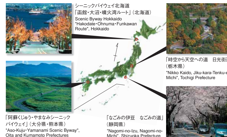
表紙：日本風景街道 Cover : Scenic Byway Japan

自然、歴史、文化、風景などをテーマとして、「訪れる人」と「迎える地域」の豊かな交流による地域コミュニティの再生を目指した、美しい街道空間の形成を進めるのが「日本風景街道(シーニック・バイウェイ・ジャパン)」です。「街道の担う役割の復古・再生」「地域資産の活用」「新たな・多様な価値の創造」「使われ方の負の遺産の清算」を地域住民や企業と行政の協働で行います。 ( http://www.hido.or.jp/fukeikaidou/ )