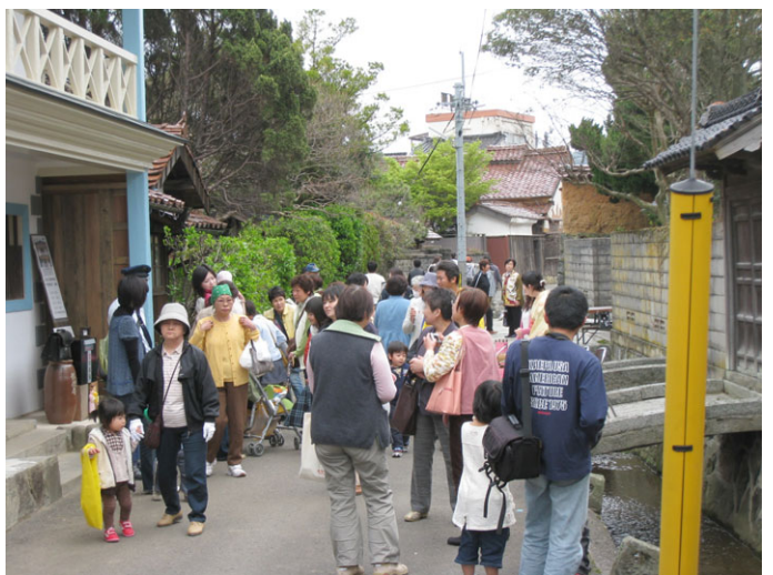
活性化イベント 本町ふらり歩き