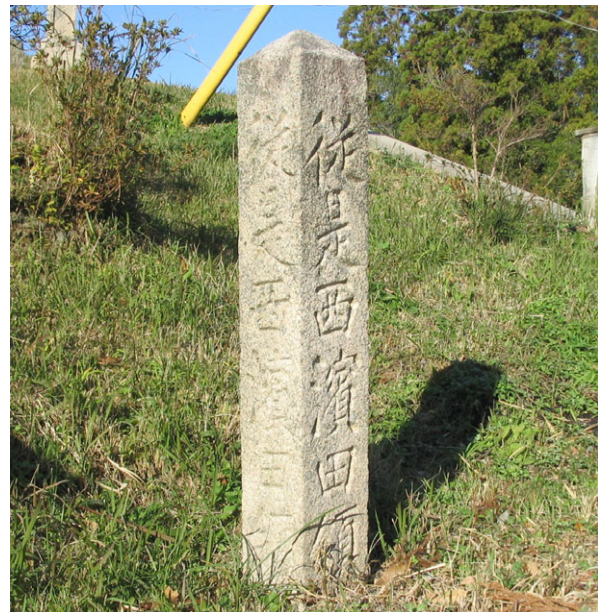
浜田藩との境界に建つ天領界標柱

平成11年頃から地元建築士会や神奈川大学建築史研究室による街並み調査が行われ、繁栄の面影を色濃く残す江津本町の価値を広く市民が認識するところとなり、地区住民によるまちづくり協議会が組織されました。それまで誰も気付かなかった地域の価値を地域の資源として活かしたまちづくりができないか議論されるようにな