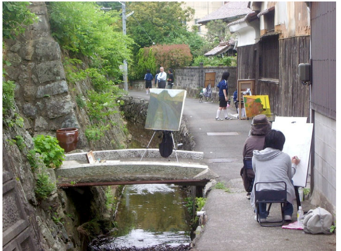
高校生による絵画講習会

天領江津本町薨街道では、このような考え方に基づいたまちづくりを実現するため、市教育委員会とも連携しながら街なみ環境整備事業に取り組む、住民の日常生活に密着した道路整備も進めたいと考えています。