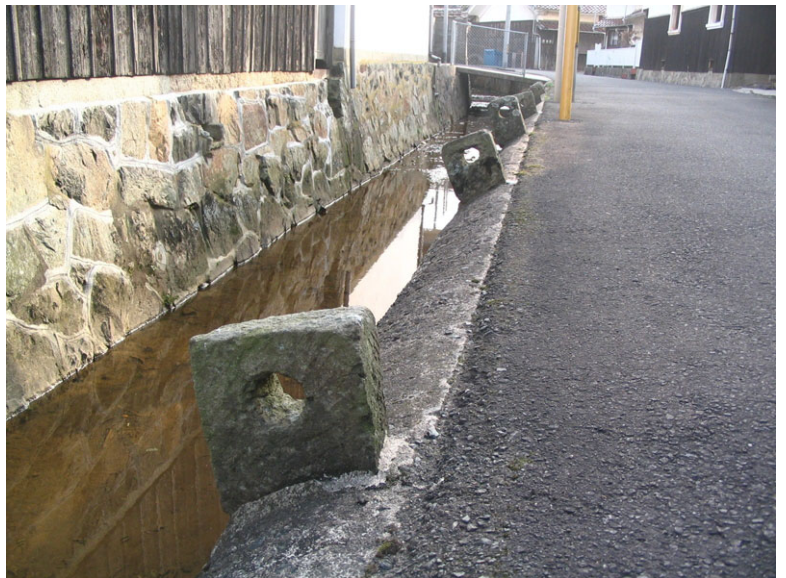
市道に残る鼻ぐり石

りました。平成16年には「天領江津本町 薨街道」として国交省などが支援する夢街道ルネサンス認定地区となり、江津市においても住民活動を支援するかたちで平成19年度より街なみ環境整備事業に着手し、歴史的な建造物の保存活用や民間住宅の修景を進めるとともに、下水道整備の進捗にあわせた市道の美装化などを進めることとしました。