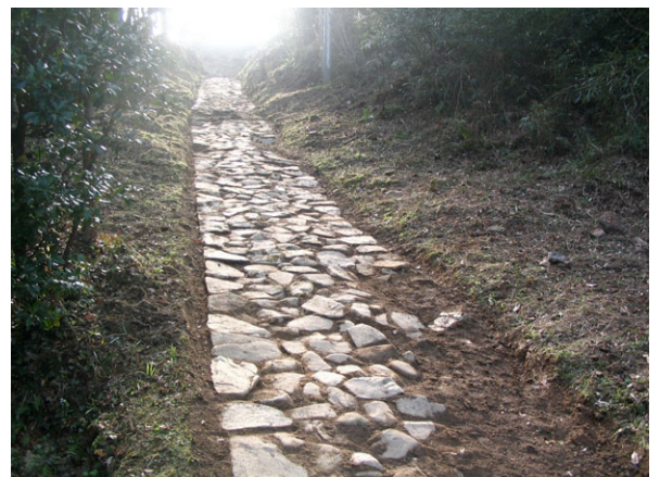
古代山陰道の石畳がそのまま残る市道