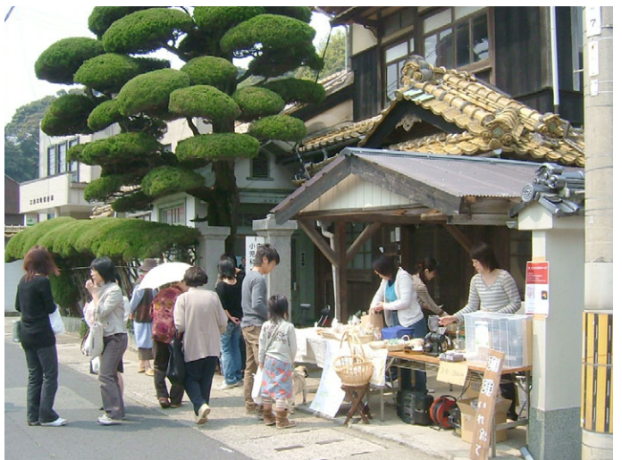
ガレージショップ