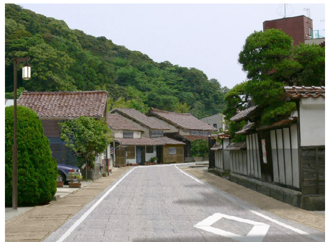
道路美装化・無電柱化 イメージ