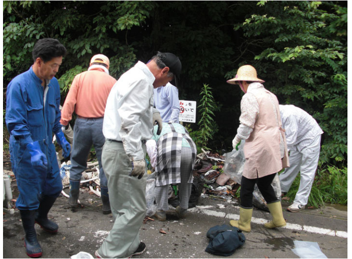
■町内会による清掃活動