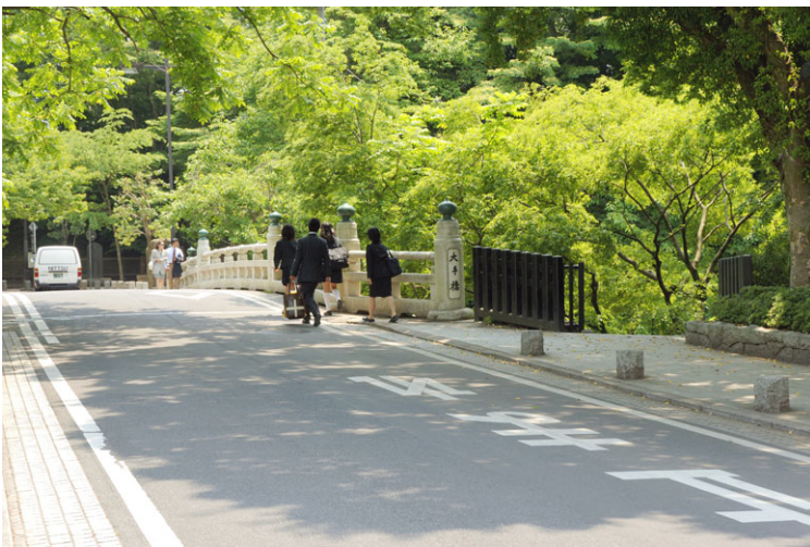
■三の丸歴史ロード（大手橋）