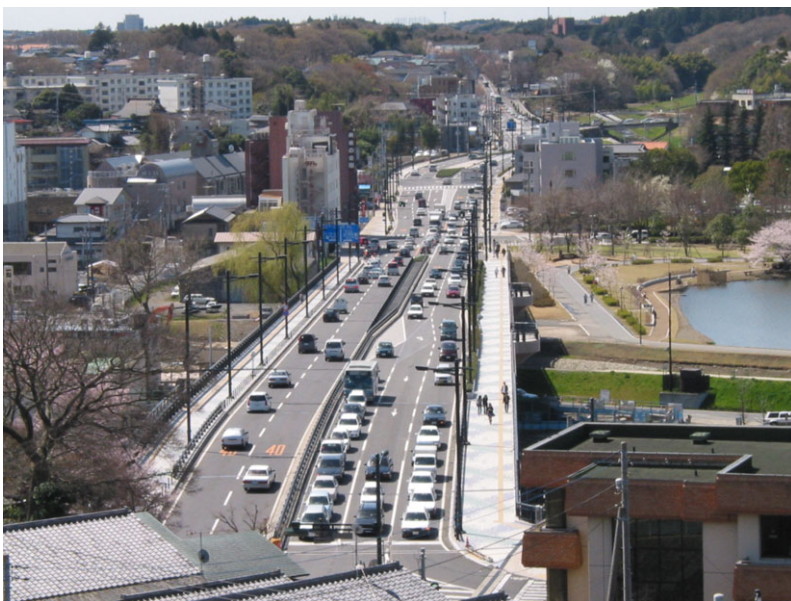
■千波大橋（都市計画道路梅香下千波線）