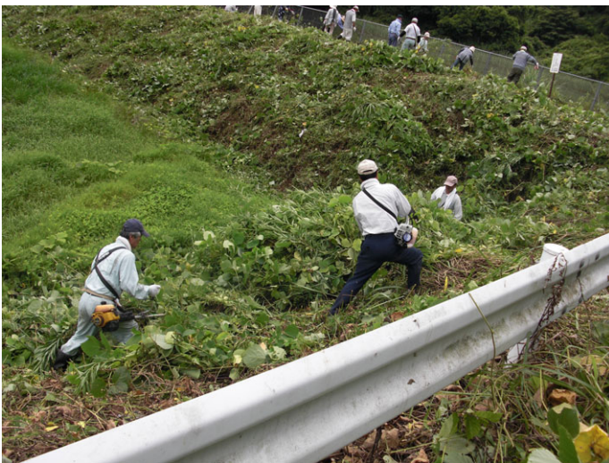
■町内会による道路法面草刈り