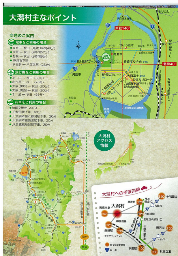
大潟村観光マップ