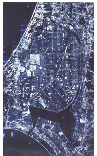
新生の大地 大潟村