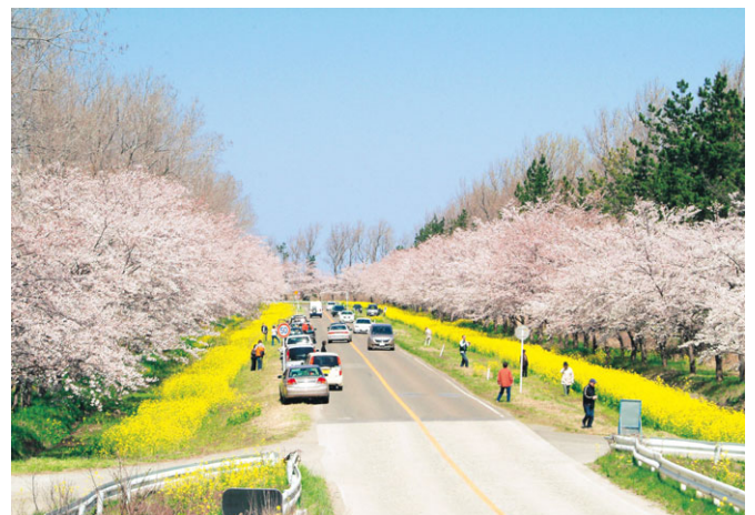
桜と菜の花ロード

2000年（平成12）には県道沿い地場産の農産物を販売する「産直センター潟の店」と、八郎潟干拓とモデル農業大潟村を未来に伝える「干拓博物館」がオープンし、2008年（平成20）には道の駅「おおがた」となり、多くの来村者を迎え入れてくれます。