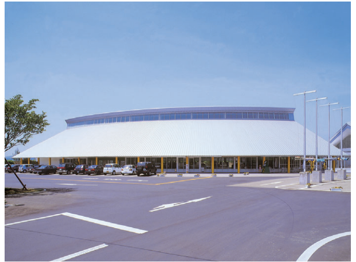
産直センター潟の店 道の駅おおがた