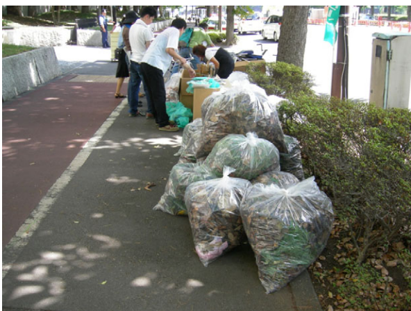
写真5 集められたゴミ、枯葉、雑草など1