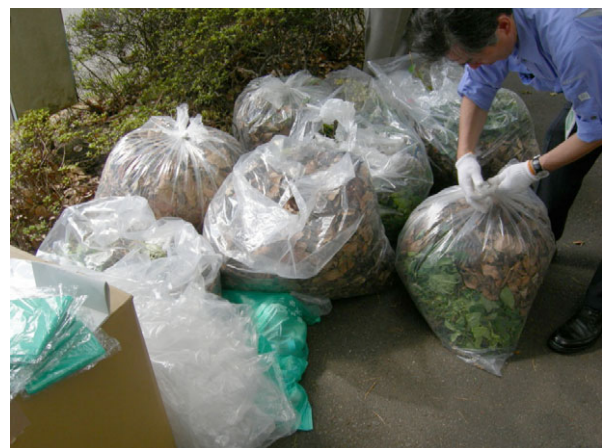
写真6 集められたゴミ、枯葉、雑草など2