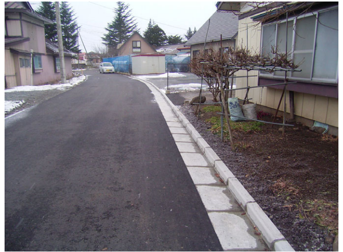
市道の道路維持管理状況