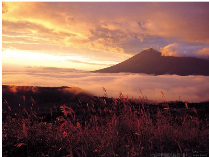
「岩手山・八幡平の夕焼け」