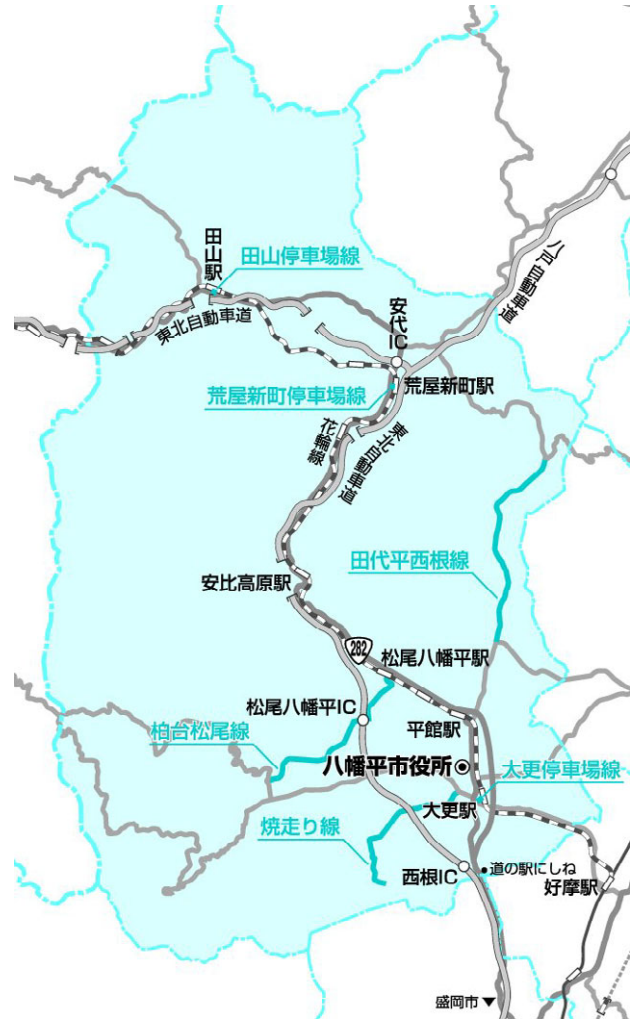
権限移譲を受けた県道6路線