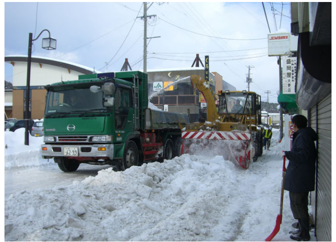
権限移譲を受けた県道の運搬排雪