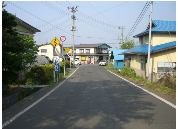
一般県道焼走り線の現況写真