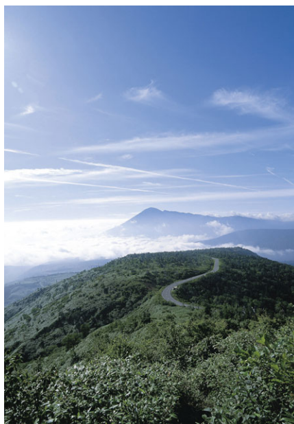
「八幡平アスピーテライン」

県道の権限移譲をいただいたことにより、市では県道と市道を一体として道路の管理を行っています。