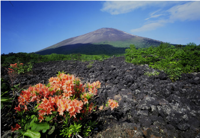
岩手山焼走り熔岩流