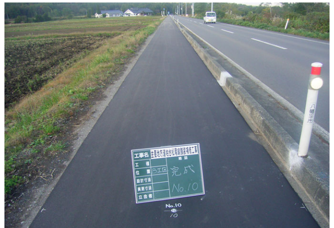
権限移譲を受けた県道（歩道）の舗装補修