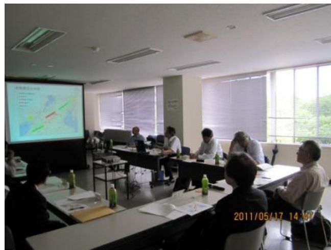
利用計画検討会の様子

その他、③伊賀サービスエリア占用事業者募集要項、④選定基準並びに⑤スケジュールの各案について議論がなされ、各委員より「地元産の食材の使用や地元雇