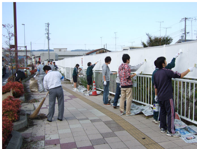
落書き消し作業状況