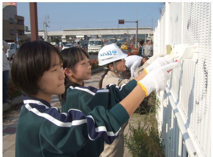
真剣な表情で作業する中学生たち