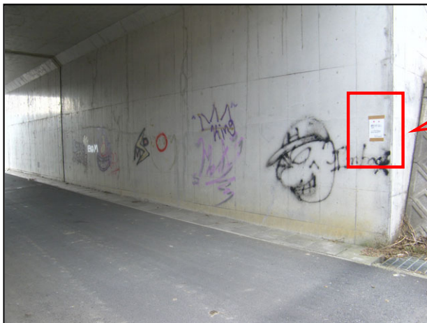
横断BOXへの落書き事例

しかし、このような警告を行っても落書きが減少することはなく、逆に巧妙で広範囲に描かれるものが増えてきています。