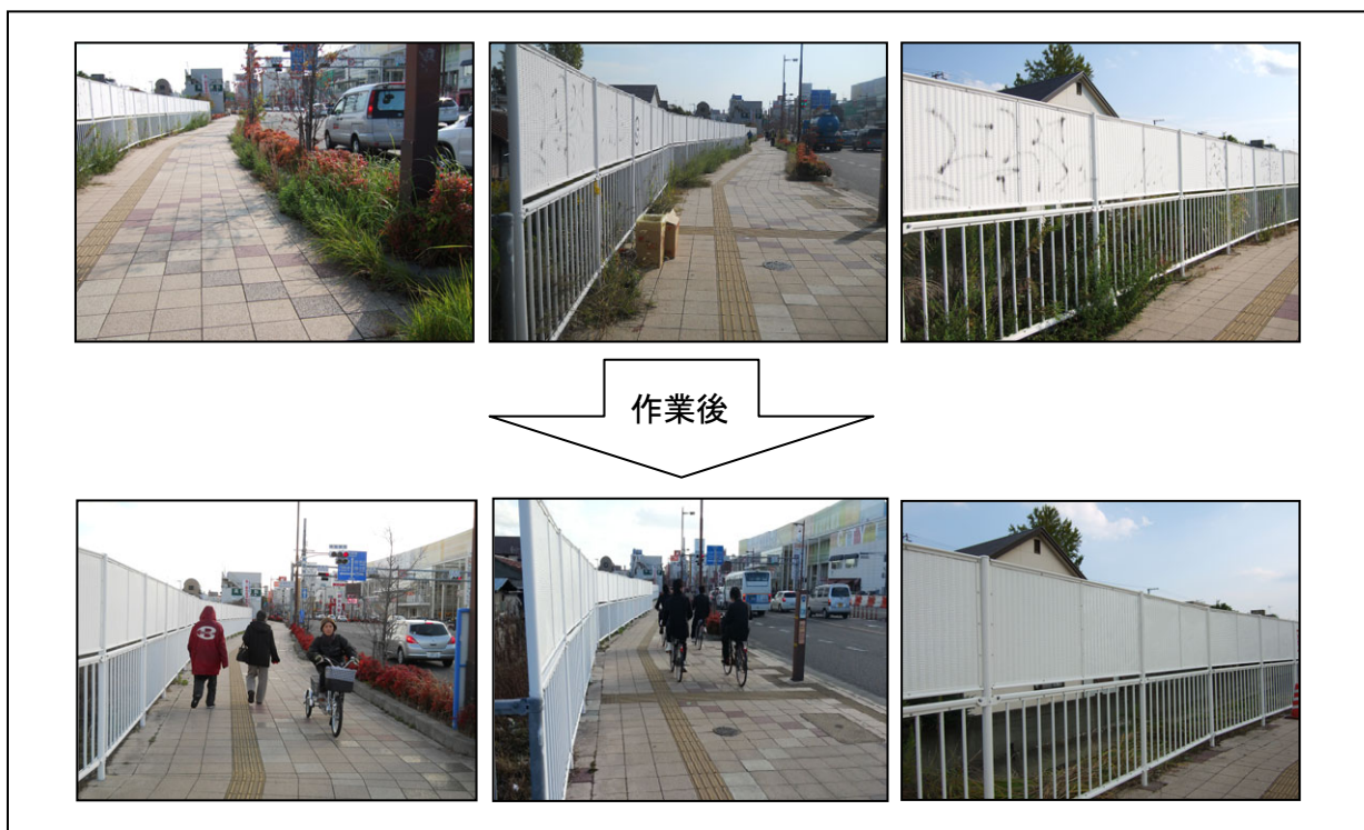
作業後の現場状況