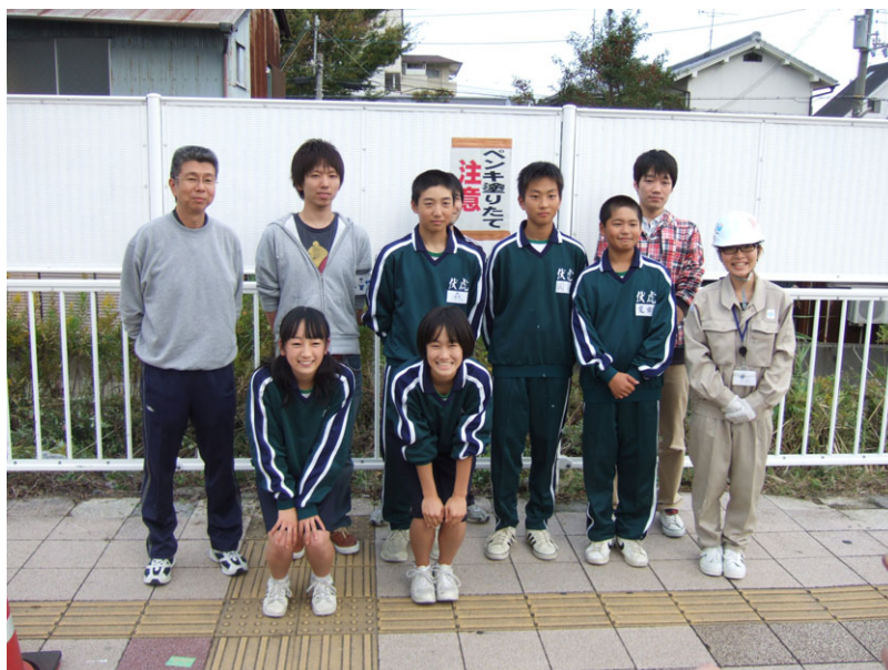
参加いただいたみなさん