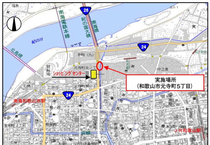
落書き消し作業箇所位置図

作業スペースについては、歩道幅員が4m以上あることから安全に作業するスペースを確保し、一般の通行者の通行の支障にもならないことを確認しました。さらに、国道24号と国道26号和歌山北バイパスの合流点にあたり、近隣のショッピングセンターに向かう最寄りの