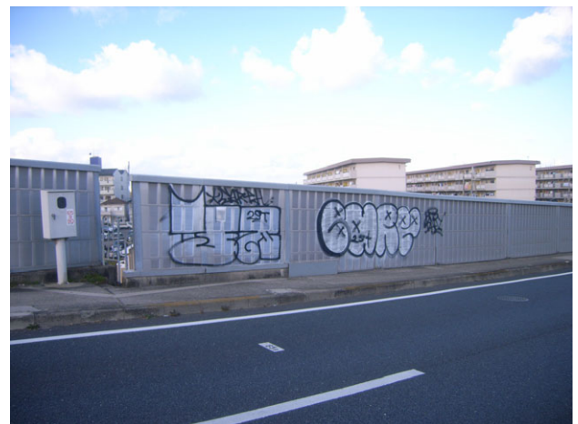
遮音壁への落書き事例

落書きを発見した場合、差別的なものや個人を誹謗中傷する内容を除き、警告貼紙（『警告 落書きをやめて下さい。我々もパトロールをしています。もし、落書きを目撃されたら和歌山国道維持出張所に通報をお願いします。』）の掲示により再発防止警告をおこない、一定期