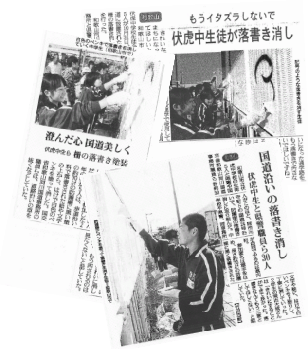
掲載された新聞記事

最後に、作業をやり遂げた達成感とペンキで白く汚れた体操服姿で誇らしげに笑っていた生徒達の素直な眼差しが印象的でした。