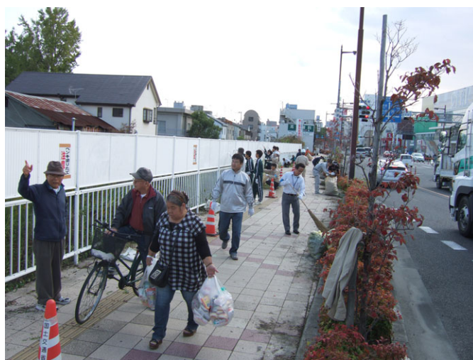
落書き消し作業を見守る歩行者