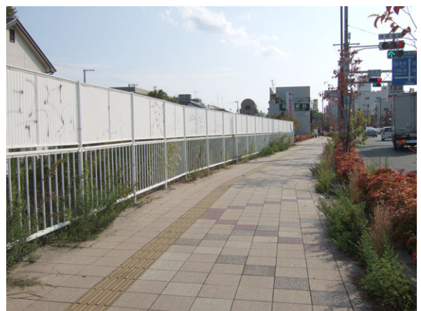
落書き消し作業箇所（当時）