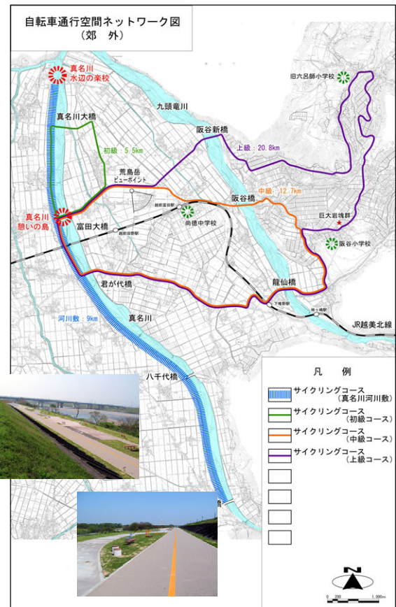
大野市自転車走行空間ネットワーク図 (案)