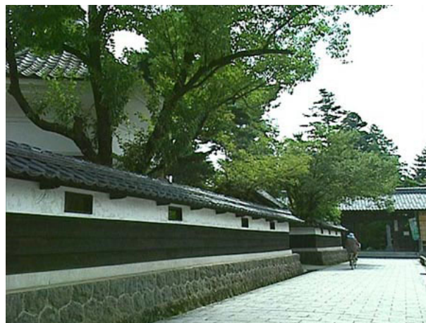
城下町の風情が残る寺町通り