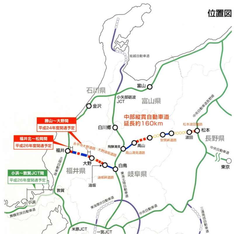
中部縦貫自動車道の整備状況

東日本大震災後、災害に強い国土づくりのため、ミッシングリンク解消による高規格幹線道路網の早期完成が求められているなか、日本海側と太平洋側を繋ぐ国土東西軸の要として、早期整備の必要性が広く認識されるようになってきており、関係各位のご尽力もあり着実に整備が進んでいます。