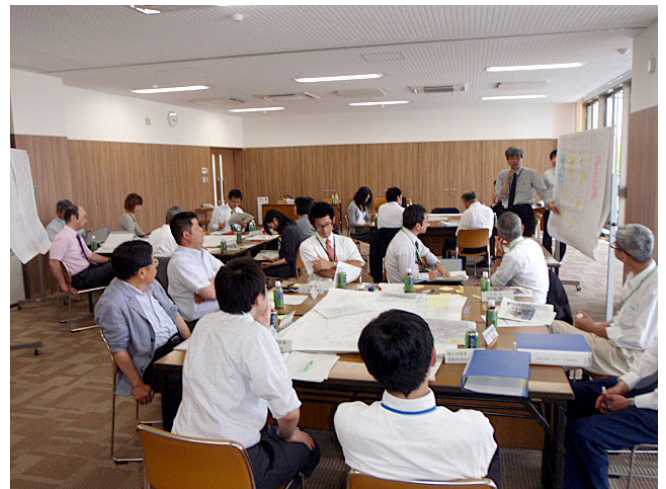
自転車を活用したまちづくり検討委員会での議論