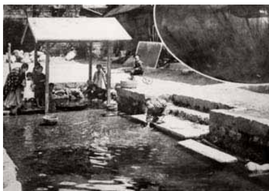
昭和初期の御清水