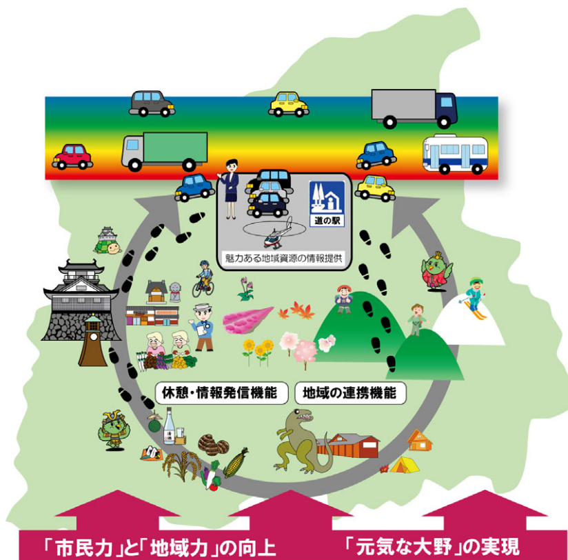
越前おおのまるごと道の駅ビジョンイメージ

今後はこのキャッチコピー「結の故郷 越前おおの」にふさわしい地域や人となるような取組みを進め、全国に発信し、交流人口の拡大を目指していきたいと考えています。