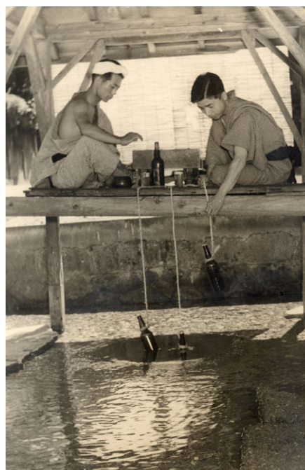
昭和 30 年代の湧水地