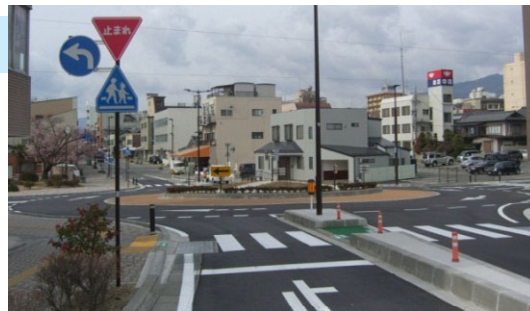
視認性と見通しに配慮した交差点

また外周部は低木を中心とした植栽とすることで、中央島の存在を認識させつつ、交差点の見通しに配慮しています。