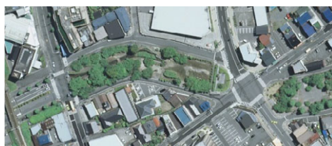
整備前(平成21年現在)

特に、東和町交差点はRABに改良したことにより、従前の多枝の機能を継続しつつ、安全性の高い交差点とすることができました。