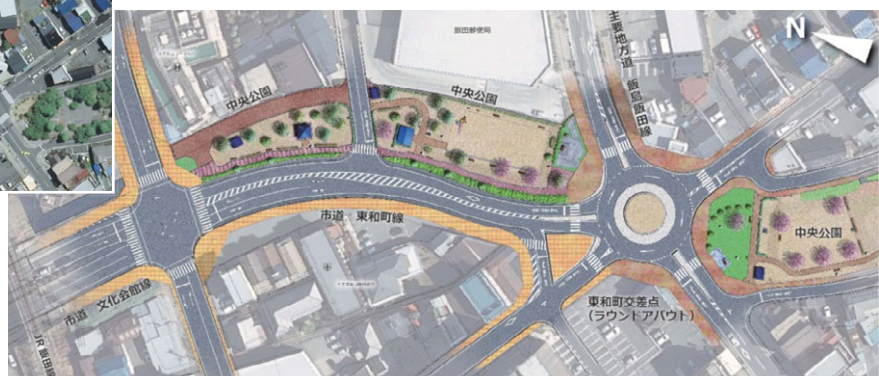
交差点を含む一連の事業