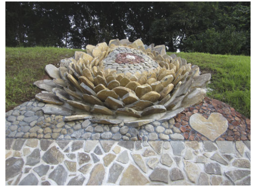
第1号の“石花”ダリア

また、町発注工事のため施工業社は、造形物の作品となることで価値と評価が上がり、作品ごとに技術力とアイデア・デザイン力が向上し、長島町が推進する石積擁壁の施工技術（積みかたや石面の見方）もアップしました。