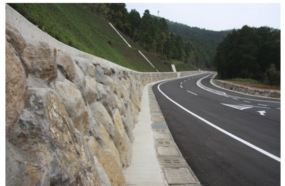
景観と除草対策に配慮した石積み（改良工事）

このようなことから、雑草法面が減ることで道路の視野が広がり、車両の安全走行の向上にもなり、良い効果の派生になっています。今後も、長島の“石”財産を大切に生かしながら、公共工事の特性でもある雇用の場と経済循環を図るとともに、維持管理については効率と軽減化を図りながら長島の景観向上を目標としています。