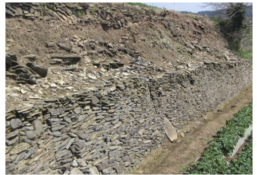
平石の出土状況と先人の石積み