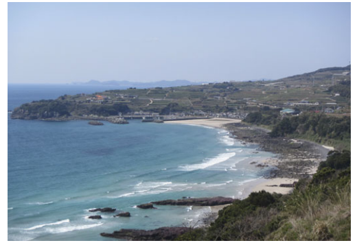
風光明媚な海岸線

そこで、平成19年度から天然石を埋立処分するのではなく、石積み花壇と平石を法面の保護材として再利用する事業が計画されました。この事業では、さまざまな経済効果や雇用対策、今後の課題となっている維持管理の削減効果となり、最終処分量の縮減に大きく貢献できています。