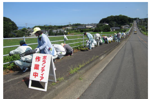
ボランティア状況