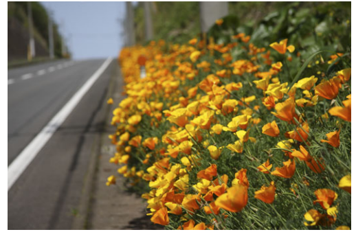
沿線脇の石積み花壇に咲くハナビシソウ