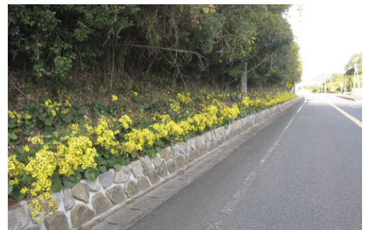
石積み花壇とツワブキの花

しかしながら困った点もあり、春先の新芽を食用とされるかたが、未熟な根から全てを持ち帰ったり、抜けたまま放置している箇所もあります。そこで、沿道で採取されているかたがいるときはモラルとマナーを守っていただけるようみんなで声掛けも行っています。今後は安全で気軽に持ち帰れるようなゾーンの指定と農園も必要と考え、現在育苗に取り組んでいます。