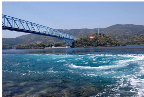
黒之瀬戸大橋と渦潮