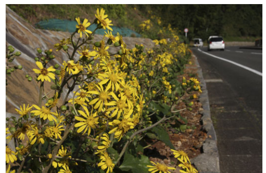
咲き誇るツワブキの花