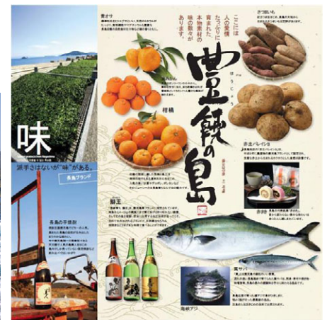
長島町特産品の一例