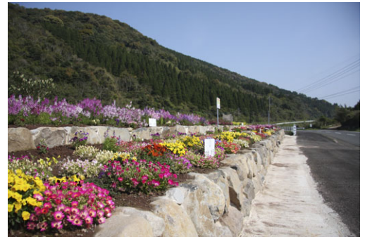
景観管理団体の石積み花壇

週末や連休にはドライブコースとして定着し、ツーリングやサイクリング、このほか親子連れでの釣りなど多くの観光客が増加しています。