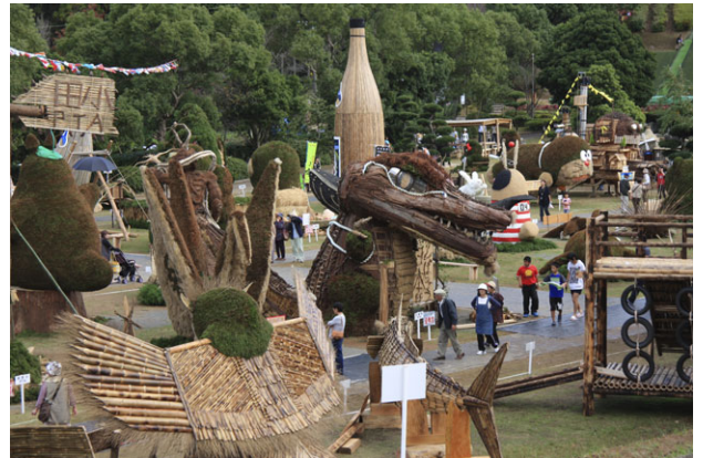
長島造形美術展会場内の作品

魅力ある“長島”を今後担っていく子供たちが、長島に生まれ育った自信と誇りを抱き続けるようさまざまな施策を打ち出し、チャレンジしていこうと思います。