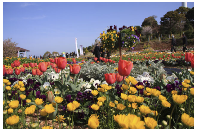
花フェスタ会場内の花ばな