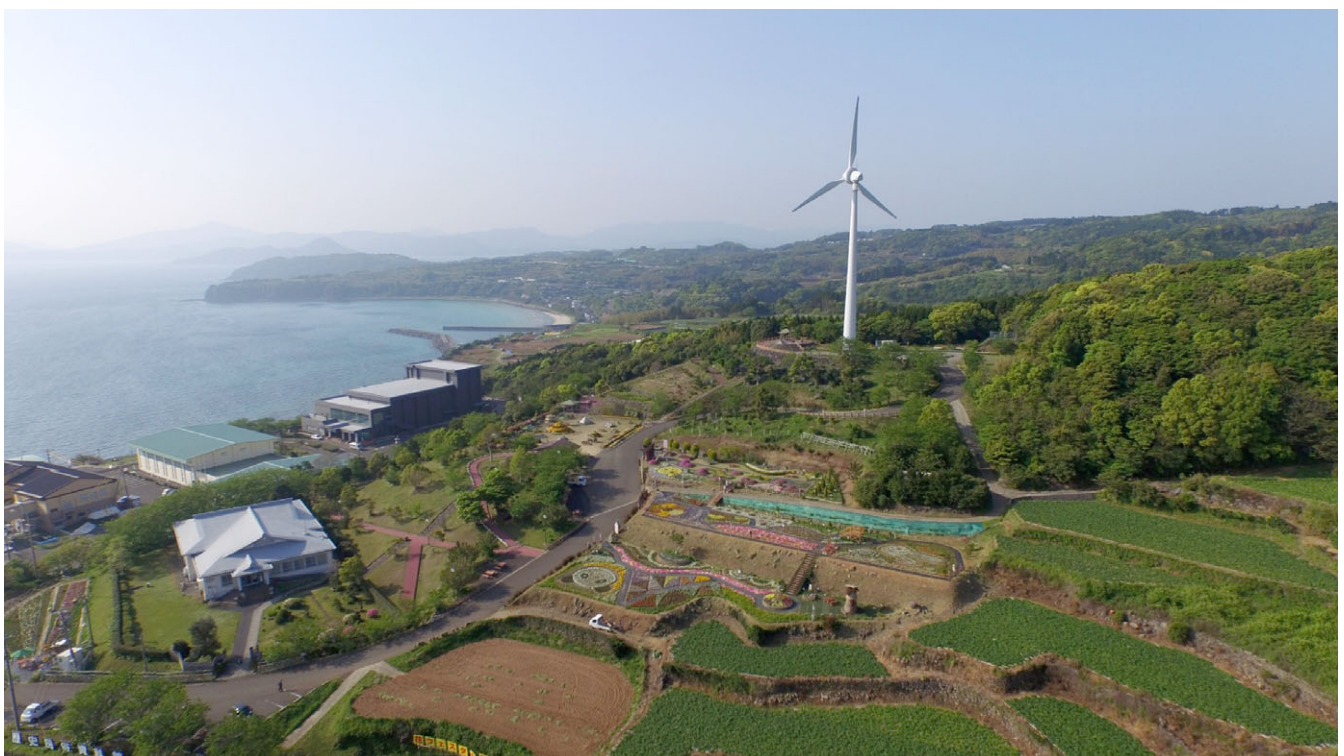
風車周辺から天草までを望む