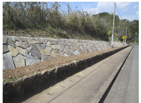
景観と除草対策に配慮した石張り