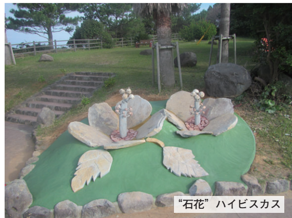
“石花” ハイビスカス