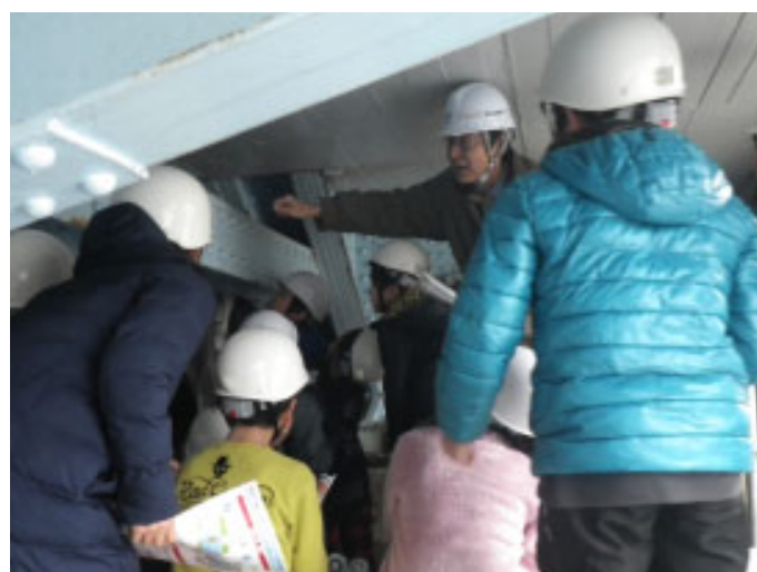
万代橋での現地見学会