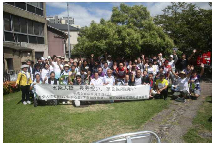
五条大橋の橋洗い（クリーンアップ・シンデレラ大作戦）