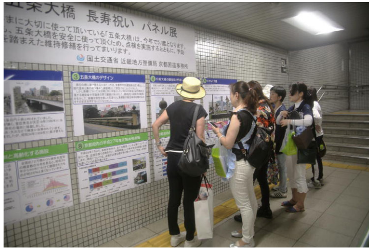
五条大橋パネル展示（京阪 清水五条駅）