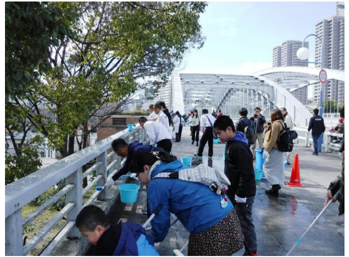
感謝をこめてみんなで橋洗い