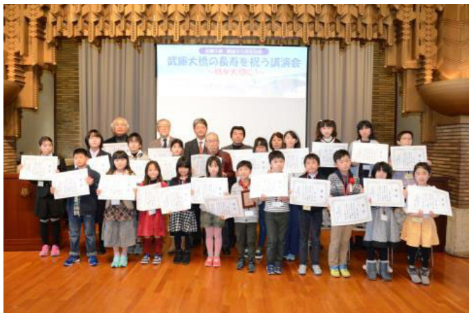
絵画コンクール表彰式