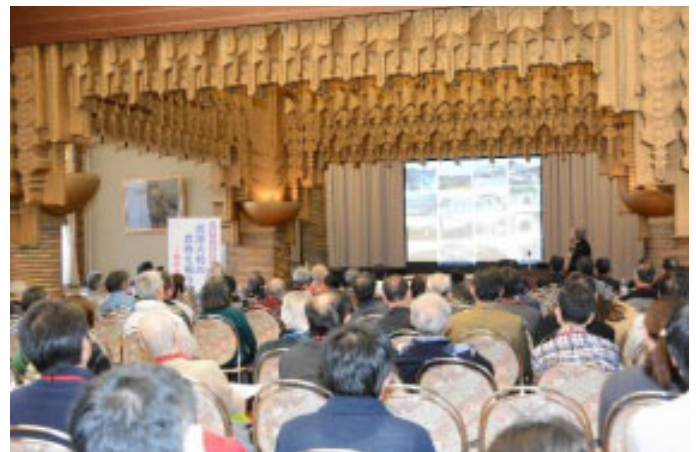
武庫大橋の長寿を祝う講演会