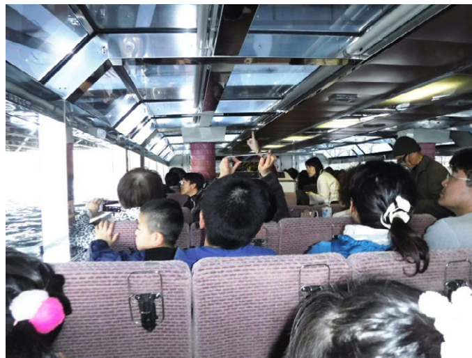
クルーズ船より桜宮橋を見学