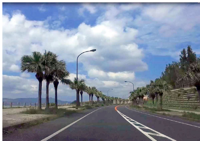
写真1 リゾート沖縄を演出する道路空間（沖縄県名護市）

沖縄総合事務局では、道路交通の安全と快適性を高めるとともに、亜熱帯特有の自然や独特な風土・歴史・文化を感じさせる道路景観の創出を目的とした、道路緑化に取り組んでいます（写真1）。その結果、直轄国道における都道府県別の道路緑化率は66.4%で全国3位（国土技術政策総合研究所資料 No.506,2009）、都道府県別道路延長あたり高木本数は182本/kmで全国2位（国土技術政策総合研究所資料 No.780,2014）と、道路緑化の整備は高い水準となっています。