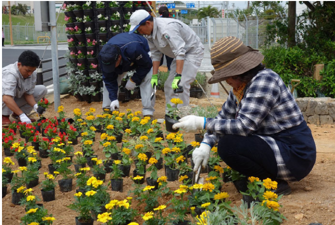
写真5 植栽ボランティア状況

花壇づくりを実施しました（写真5、6）。写真5は、花壇でのグリーンアドバイザー ※ による植栽ボランティアの様子で、設計図面を踏まえつつ、植栽配置は現場で調整するなど質の高い演出を目指しました。写真6は、ボランティア・サポート・プログラム団体である美ら島フラワーロード協議会事務局がフラワータワー3基を設置したものであり、立体的で彩りのある車窓景観を演出しました。