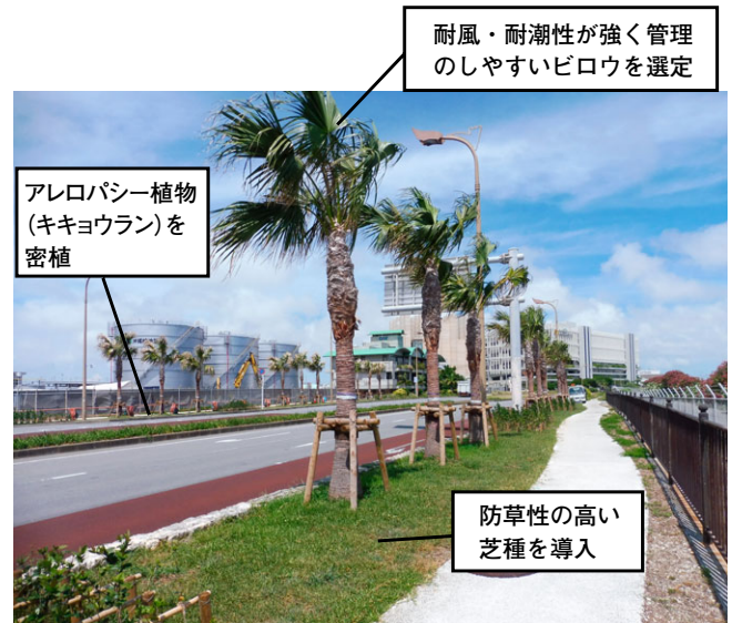
写真 3 国道 332 号植栽状況

また、ウェルカムロードとして花による観光客への歓迎を込めた華やかな空間を演出するとともに、道路景観にアクセントを加えることを目的として、国道 332 号沿道に花壇を整備・計画しています（図 1、写真 4）。草花は他の植栽よりも維持管理費が高いため、交差点周辺など、車や歩行者の目にとまりやすい場所（ビューポイント）に限定し、アレロパシー植物 ※ やカラーリーフを組み合わせる植替え手間を軽減するなど、維持管理費にも配慮しています。