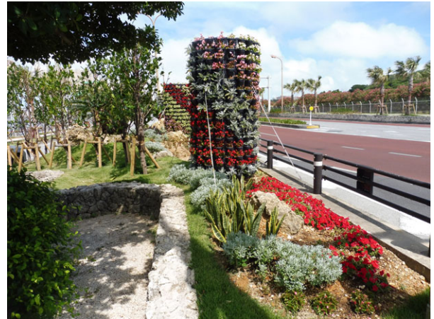
写真6 フラワータワー設置状況