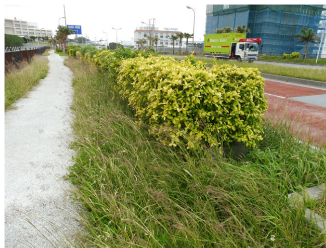
写真2 生長が旺盛な雑草の繁茂

このことから、魅力ある道路景観の形成を図るため、管理作業の適正化と効率化の検討、防草対策の検討、選択と集中による植栽計画検討、地域住民や団体等との協働による植栽管理手法の検討など、効