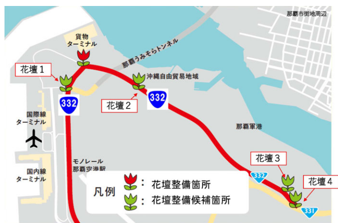
図 1 国道 332 号花壇の整備箇所・整備候補箇所位置図