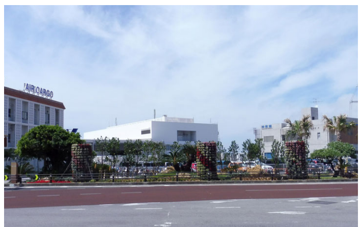
写真 4 国道 332 号花壇の整備状況