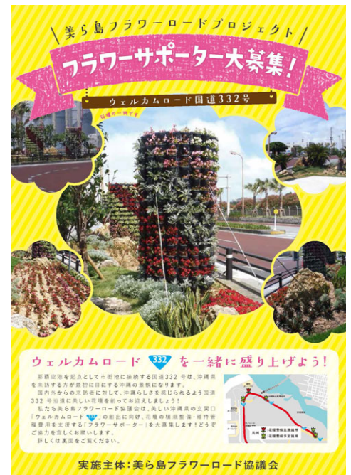
図3 フラワーサポーター募集チラシ

美ら島フラワーロードプロジェクトの専用ホームページを事務局である沖縄美ら島財団ホームページ内に設け、プロジェクトの取組み、参加企業・団体の紹介、サポーター及びボランティア協力団体の募集など、情報発信を行います。