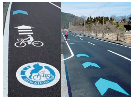
写真：青矢羽根本設置

平成 29 年度からは植栽帯などのスペースを有効活用し、路肩を広げ自動車と自転車と歩行者それぞれの空間を確保できるよう整備を進めています。