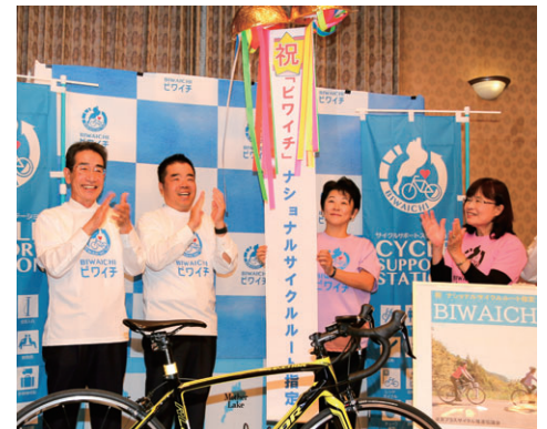
写真：指定記念イベント（県庁内）