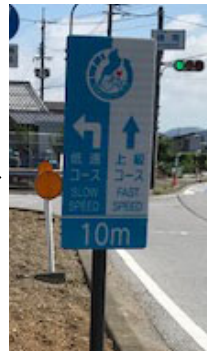
写真：案内看板の更新（2か国語対応に更新）