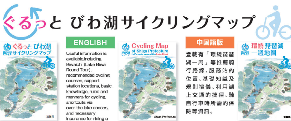
写真：サイクリングマップ

平成13年、県は琵琶湖沿岸の市町や関係団体と協力してサイクリングの中・初級者が走りやすい193kmのコース「ぐるっと琵琶湖サイクルライン」のマップを作成し、配布を開始するとともに、案内看板や距離標を整備し、環境整備を行いました。この頃から、インターネット上で琵琶湖一周の略語である「ビワイチ」が散見され、サイクリングファンの間で広がり始めたと考えられます。