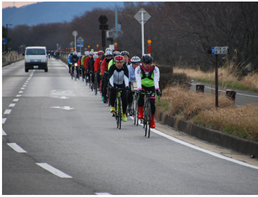
写真：自転車通行空間整備例【整備前】