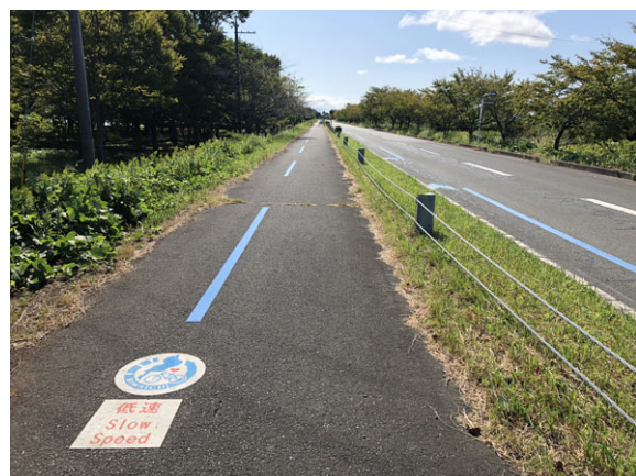
写真：青矢羽根の整備（低速コース）

主要交差点や分岐点では、分岐前、分岐点、分岐後の計3か所にルート案内する看板や路面表示を設置しました。また、観光地や休憩所、トイレなどの主要施設への案内看板の設置も新たに始めました。その他、集落内道路や農道等、走行形態が変わるところでは看板や路面表示により注意表示も行っています。そして、それぞれ日英2か国での表示やピクトグラム化を進め、だれもがわかりやすい案内表示に努めています。