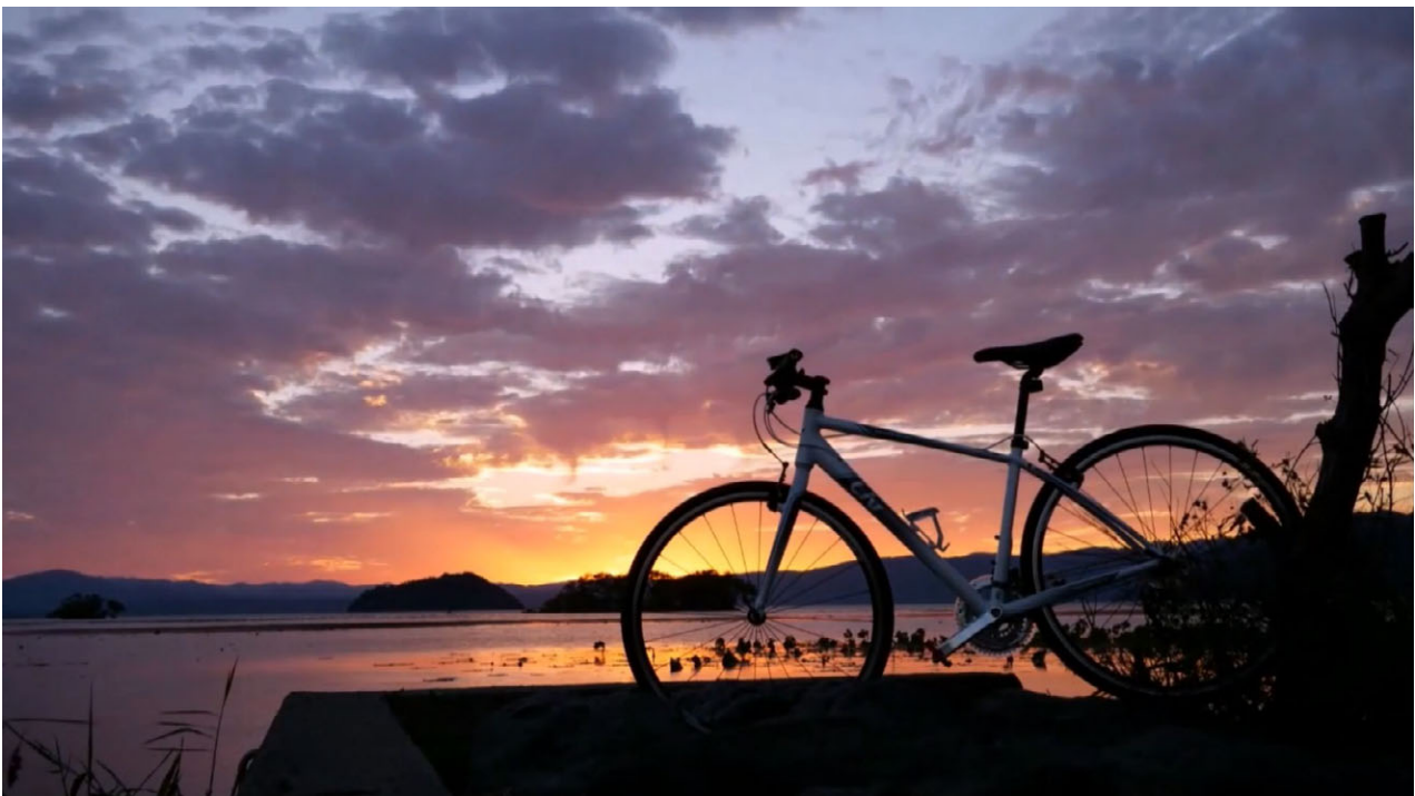
写真：琵琶湖湖畔の夕景

今回の指定で「ビワイチ」のブランドイメージや知名度が大きく向上すると考えられ、国内外からの来訪促進がより一層進むことが期待できます。しかし、今回の指定をゴールとするのではなく、引き続き、走行空間整備や安全対策は継続して進め、「より安全に」「より快適に」誰もがサイクリングが楽しめる環境づくりに取り組んでまいります。