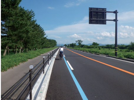
自転車専用通行帯の整備（上級者）