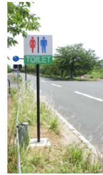
写真：主要施設への案内看板