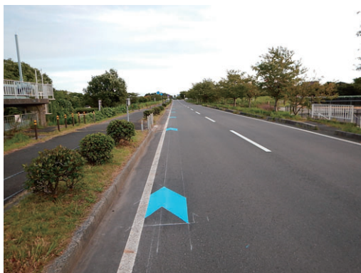
写真：青矢羽根の試験施工

こうした結果を受けて、矢羽根の段差を避ける場合には車道中央側ではなく車道左側を走行してもらうため、青矢羽根の位置を外側線から 15cm 離して設置する等により、快適性と安全性を確保しつつ、自動車に対して自転車が通行する注意喚起をすることができました。