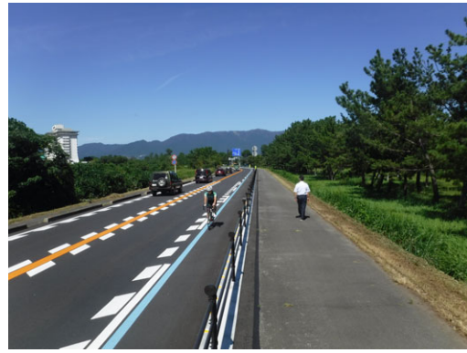
写真：自転車通行空間整備例【整備後】

さらに、今年度には県道の道路構造を定めた条例の一部改正を行い、「ビワイチ」ルート上の自転車歩行者道のように歩行者利用が少なく自転車が快適に走行できているところについて、幅員に縮小規定を設け、自転車歩行者専用道路の指定ができるようにしました。また、指定の際には、安全な速度での走行を促す看板、路面標示等を設置し歩行者に対する安全対策も行っています。