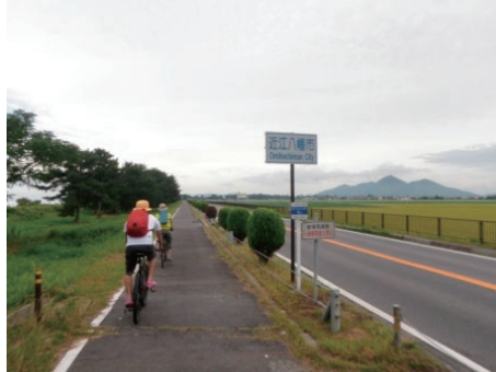
自転車歩行者専用道路（中 / 初級者）