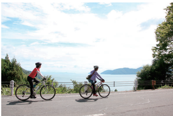
写真：ビワイチサイクリング（長浜市）

193km は、走り慣れたサイクリストなら1日で走れる距離ですが、おすすめは2～3日かけて宿泊し、県内をゆっくり観光・食事を楽しみながら走るビワイチです。ビワイチを完走したことで得られる達成感、高揚感、満足感に加え、ルート沿いの美しい風景や歴史遺産、滋賀の郷土食など数多くの魅力的なスポットをゆっくり楽しめるのが、大きな特徴です。また、琵琶湖大橋北側 150 kmや南側 50 kmだけを走るコース、さらには琵琶湖を船で横断しショートカットするコースもあります。