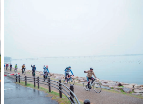
公園内通路（中 / 初級者）