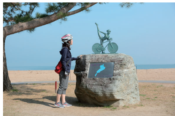
写真：サイクリングの聖地碑（守山市）