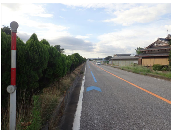
写真：青矢羽根の整備（上級コース）

ルート全体では青破線の路面表示による案内を新たに着手しました。これは滋賀県独自の取組であり、線の長さを走行レベルに応じて変更しているのも特徴です。また、この青破線はルート案内以外にも車道に設置される場合には青矢羽根の路面表示と同様にドライバーに自転車の走行位置を示す役割も担っています。