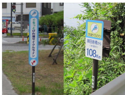
写真：案内標識・距離標 (5km 毎)

前述のとおり「ビワイチ」を楽しむ方が増える中で、走行形態にも変化が見られ、スポーツとしてサイクリングを楽しんでいるサイクリスト（上級者）が増加し、歩道や生活道路での高速走行による歩行者との接触の危険性が問題となり始めました。