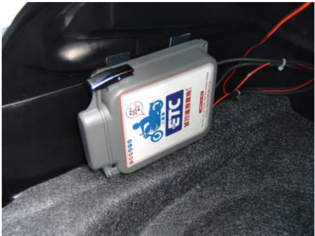
< 車載器本体部 >