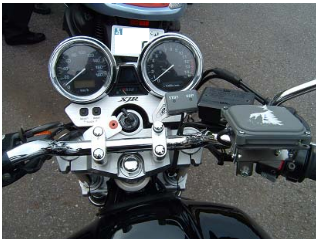
<インジゲーター部>