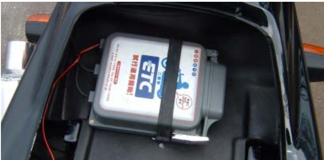
< 車載器本体部 >