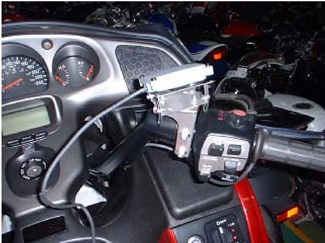
< アンテナ部 - (2)ステアリング部に取付 (ホンダ : GOLDWING) >