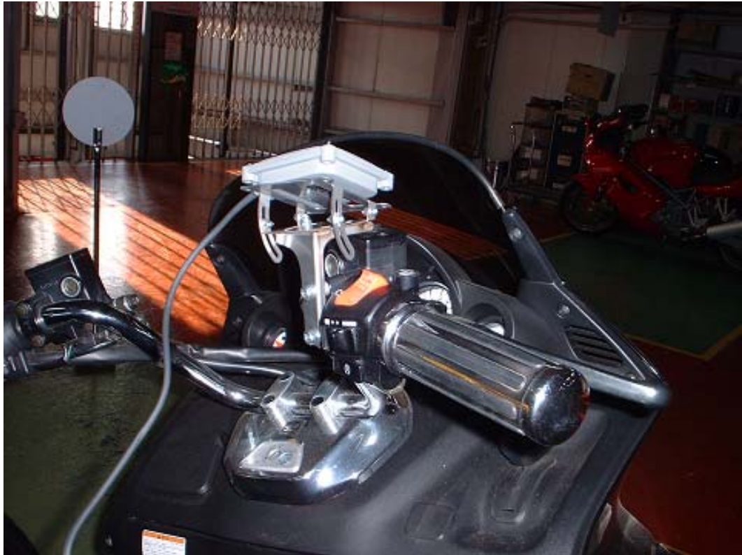
< アンテナ部 - (2)ステアリング部に取付 (ホンダ : FORZA) >