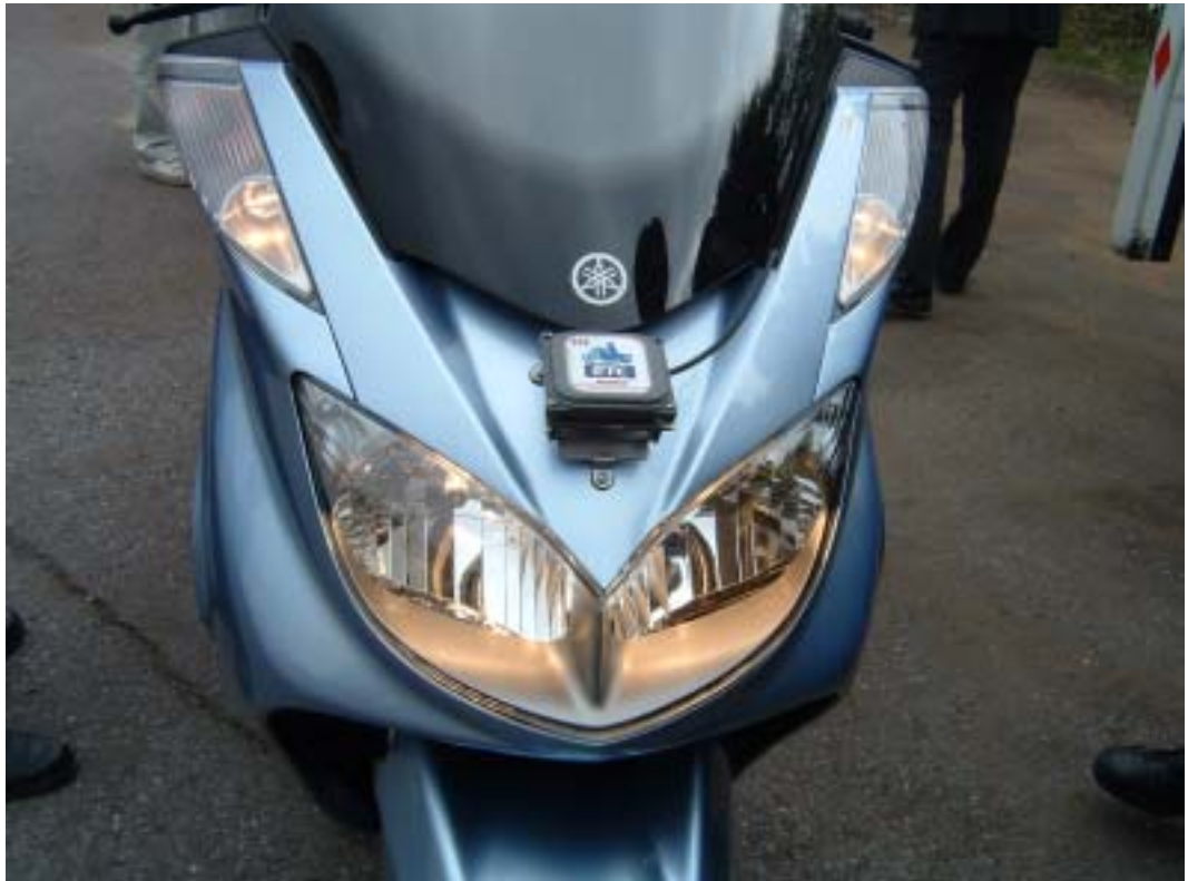
<アンテナ部 - (1)カウル前方に設置>