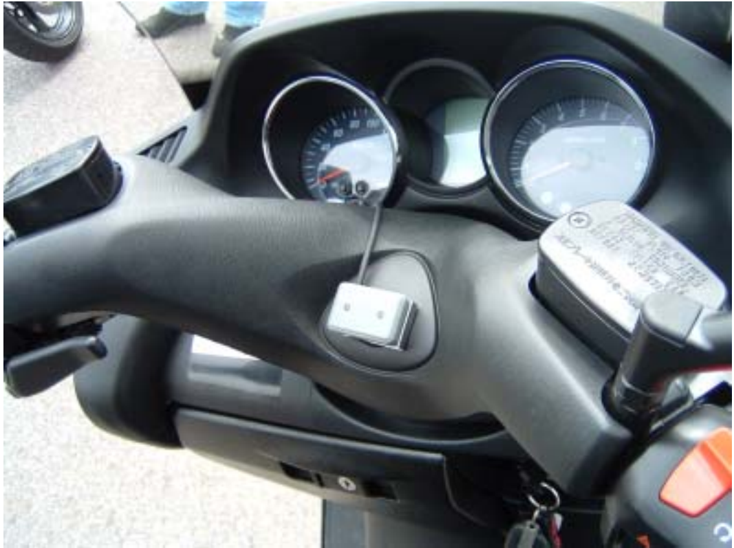
<インジゲーター部>