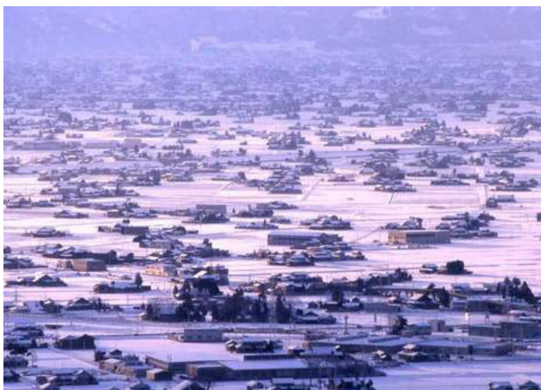
散居村風景の写真（冬）

市の平均気温は、13.4℃（最高 34.5℃、最低 -9℃）、年間降水量は、2,508mm であり、年によって差異はあるものの、概ね 12 月から 3 月にかけて積雪を見る典型的な日本海型の気候です。