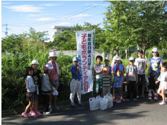
西新町会の作業風景