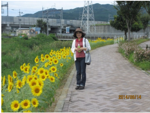
ひまわりの風景（四阿屋会）