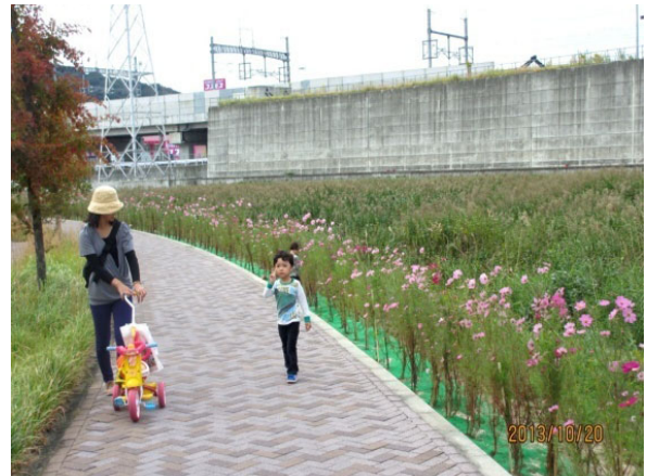
コスモスの風景（四阿屋会）