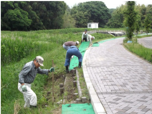
整地・種まき風景（四阿屋会）