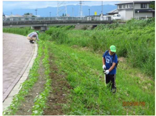
草刈風景（四阿屋会）