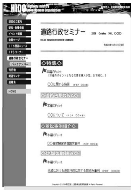
図1 ホームページ掲載イメージ