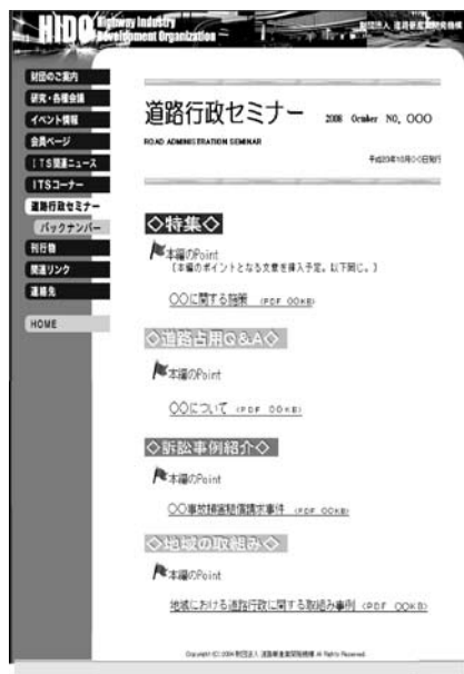
図1 ホームページ掲載イメージ